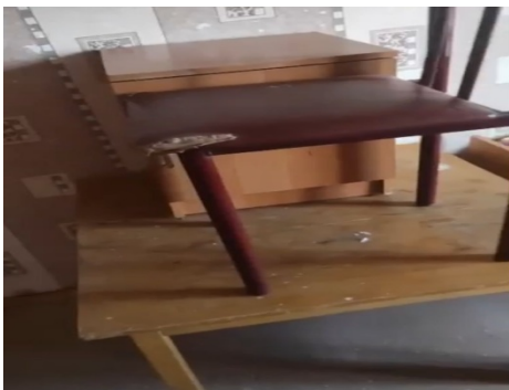
5-сурет. Шын мәніндегі студенттер үйінің қазіргі жағдайы

5-суретке назар аударсақ, шын мәніндегі студенттер үйінің қазіргі жағдайын көре аламыз. Бұл жағдайларды көп студенттер жасырып қалады, себебі оларға бұл мәселелердің сыртқа шықпауына талап қойылуы мүмкін. Бұл мәселелер көзімізбен көре отырып, осы жағдайларды шешуге үлесімізді қосқымыз келді. Суретте көрсетілгендей, студенттер өздерін суықтан қорғау үшін, терезені жабдықтауға мәжбүр. Және де жаңартылмаған жиһаздардың кесірінен студенттерге қиындық туындап жатыр. Осы мәселелердің кері әсерінен студенттер үйінің тұрғындарының саны жылдан-жылға азаюда.