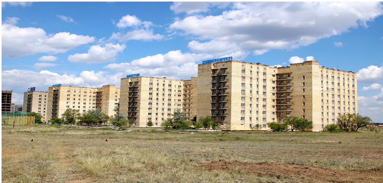
1-сурет. Студенттер үйінің сыртқы көрінісі

Е.А.Бөкетов атындағы ҚарУ студенттер үйінде қазіргі таңда республикамыздың барлық аймақтарынан келген жастар қоныстанған. Студенттер үйі 2 676 орындық тоғыз қабатты, 6 тұрғын үй және бір 5 қабатты ғимаратынан тұрады. Студенттер үйлері қаланың оңтүстік-шығыс бөлігіндегі тұрғын алабында бой көтерген кампус аумағында орналасқан. Кампус аумағында университеттік Емхана, кампустың жанында азық-түлік дүкендері, дәрханалар, қала орталығына баруға мүмкіндік беретін аялдамалар бар.